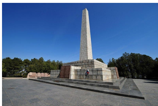
Обелиск Славы на Сапун-горе.

Глубоко под землей был построен целый город: здесь размещались госпитали, школы, детские сады, мастерские, которые производили и ремонтировали оружие и военную технику. Героическая защита Севастополя, продолжавшаяся восемь месяцев, вошла в историю как пример несгибаемой стойкости наших людей, их беззаветной преданности Родине. Только после получения приказа Ставки Верховного Главнокомандования 4 июля защитники оставили город, но продолжали героическую борьбу в тылу врага. Фашисты подошли к Севастополю, блокировали город с суши. Только морем можно было доставить оружие, продовольствие, свежие военные силы. Немцы понимали это и заминировали все морские пути. Особенно грозными были магнитные мины. Чтобы взорвалась обычная мина, корабль должен был ее задеть, натолкнуться на нее. Магнитная