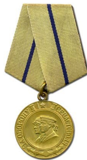
Медаль "За оборону Севастополя"