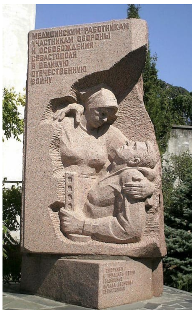
Медицинским работникам, участникам обороны и города

9 мая 1944 года Севастополь, город русской боевой славы, был освобожден. За выдающиеся заслуги перед Родиной 1 мая 1945 года ему было присвоено звание «Город-герой», а в 1965 году в ознаменование двадцатилетия Победы в Великой Отечественной войне 1941—1945 годов вручены орден Ленина и медаль «Золотая Звезда».