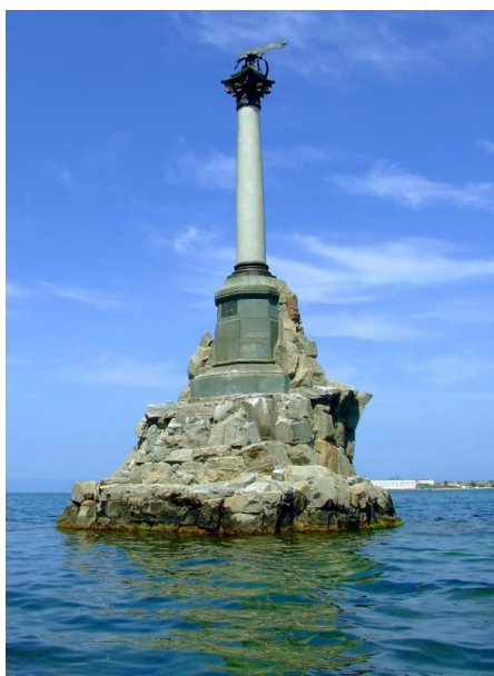
Памятник затопленным кораблям - символ города.

Советуем посмотреть «Оборона Севастополя» https://www.1tv.ru/n/22541