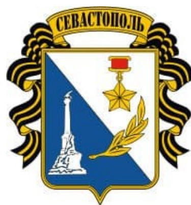
Герб города-героя Севастополя

Символ г. Севастополя, гордый памятник «Затопленным кораблям» – память и дань трагическим событиям 1853 г. – 1854 г. Ради спасения города адмирал Нахимов приказал затопить свои корабли, не дав судам врага закрепиться на рейде. В 1905 г.