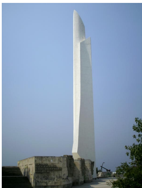
Обелиск "Штык-парус" в честь присвоения Севастополю звания «Города-героя»