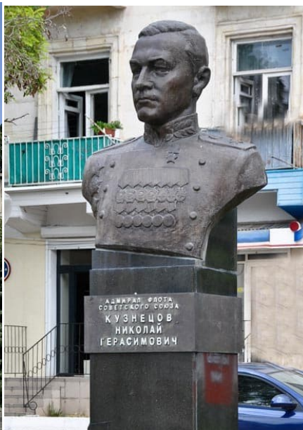
Памятник Адмиралу Н. Г. Кузнецову