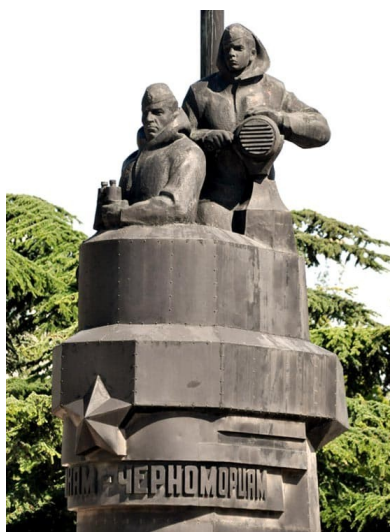
Подводникам - черноморцам