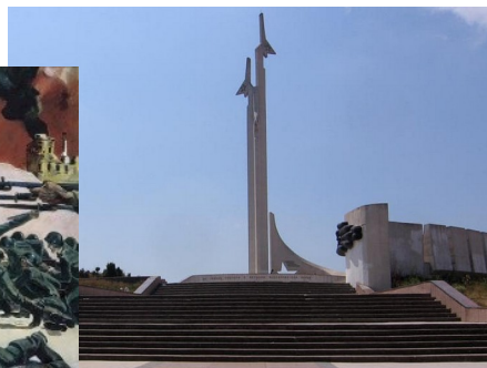
Памятник мужеству авиаторов-черноморцев