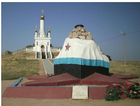
Памятник на могиле воинов 30 батареи 95 стрелковой дивизии

Для севастопольцев война началась 22 июня 1941 года, когда вражеская авиация сбросила на город первые бомбы. Прорыв немецко-фашистских войск в Крым в октябре 1941 года создал непосредственную угрозу Севастополю. Враг стремился овладеть городом с ходу, но натолкнулся на героическое сопротивление. Севастополь отважно защищали войска Приморской армии, моряки Черноморского флота и жители. 30 октября враг подошел близко к городу. Началась героическая оборона Севастополя, которая длилась 250 дней